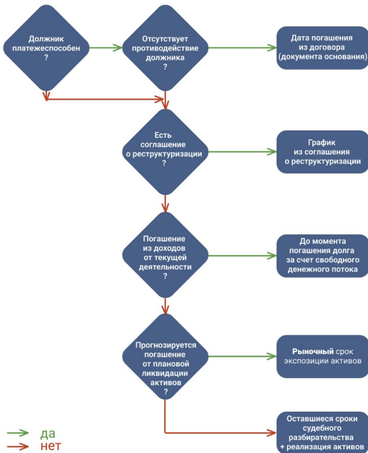
Рис. 2. Алгоритм определения периода дисконтирования

6.11. При моделировании поступлений от будущей деятельности Должника / Поручителя учитываются: фактическая периодичность поступления средств Должнику / Поручителю, сложившиеся правила делового оборота в соответствующей сфере (как правило, ежемесячные платежи).